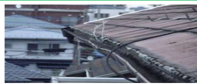
経年と雪害による雨樋の変形