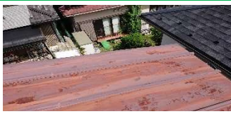
経年による屋根板金の劣化