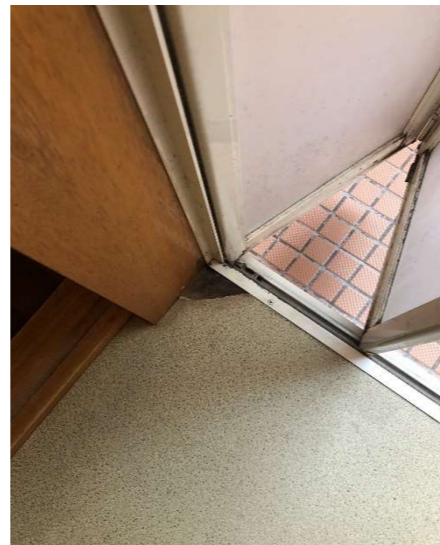
お風呂の入口が水滴により腐食し、虫が侵入。