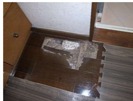
シロアリによる被害(フローリング)