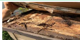
雨漏りにより腐食した出窓庇