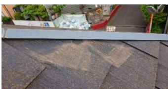
経年による屋根材の劣化

外壁を触ると粉がつく(チョーキング現象)⇒塗膜が剥がれているので、塗装メンテナンス時期のサインです。